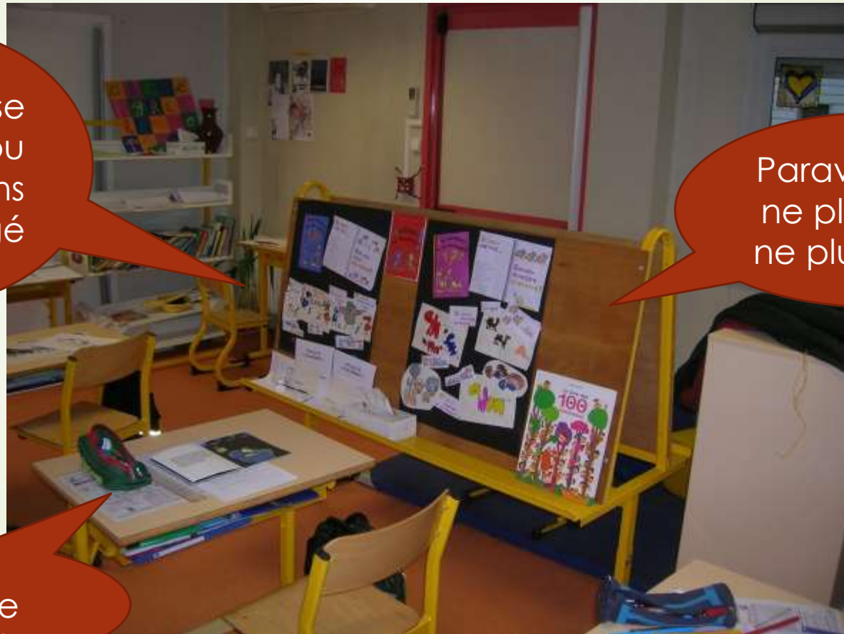
Table individuelle parmi les autres

Paravent pour ne plus voir et ne plus être vu